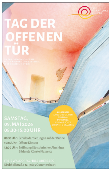
Plakat der Waldorfschule Oberberg

Es wird Schul- und Gartenführungen geben, und es gibt selbstverständlich die Möglichkeit für Gespräche mit unseren Pädagogen. Auch die