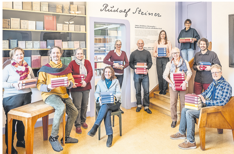
Mitarbeitende des Rudolf-Steiner-Archivs, Dornach, Schweiz, mit den GA-Bänden, die zwischen 2016 und 2025 erschienen sind

der Rudolf-Steiner-Gesamtausgabe am Goetheanum tauschen sich ehemalige und aktuelle Leitende des Rudolf-Steiner-Archivs über Erhaltung, Erforschung und Veröffentlichung von Rudolf Steiners Gesamtwerk aus. Im Haus Duldeck, dem Sitz des Rudolf-Steiner-Archivs, kann man mit Herausgeberinnen und Herausgebern über die Editions-geschichte ins Gespräch kommen; in der Goetheanum-Bibliothek informieren Mitarbeitende des Rudolf-Stei-