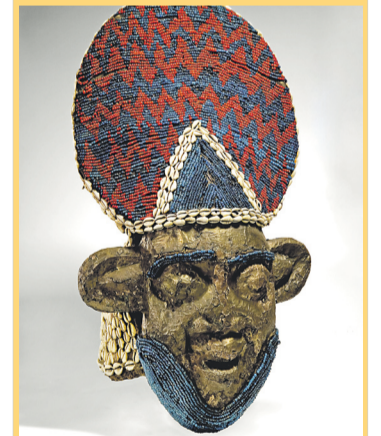
Helmmaske tu nkum mpelet / Sammlung Thorbecke / Bamum, Kameruner Grasland

Die Aufarbeitung von Sammlungen aus kolonialen Kontexten stellt die Museen in Deutschland vor große Herausforderungen. Oft fehlt es an der finanziellen und personellen Ausstattung, um diese wichtige Aufgabe adäquat bewältigen zu können. Dank einer Förderung durch das Ministerium für Wissenschaft, Forschung und Kunst Baden-Württemberg in Höhe von 61.600 Euro sind die Reiss-Engelhorn-Museen Mannheim (rem) in der Lage, in den kommenden beiden Jahren Sammlungsobjekte aus Afrika zu digitalisieren und in einer Online-Datenbank öffentlich zu machen. Unterstützt werden sie dabei von einem neuen Mitarbeiter aus Togo. Der 25-jährige Germanist und Kulturwissenschaftler konnte im Auswahlverfahren überzeugen und soll die Stelle in Mannheim zum 1. April 2021 antreten.