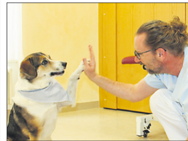
Mit Frida begrüßen wir eine besondere neue Mitarbeiterin in der Filderklinik.

Seit Anfang des Jahres erweitern wir unser integratives Therapiespektrum: Patientinnen und Patienten auf unserer Palliativstation können nun an einer tiergestützten Therapie teilnehmen.