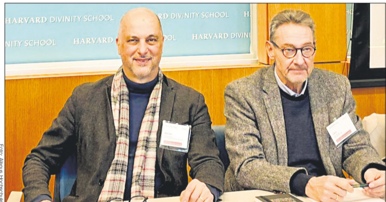
Professoren der Hochschule brachten ihre Forschungsperspektiven in Panels zu Pädagogik, Meditation, Medizin und Religionspädagogik ein