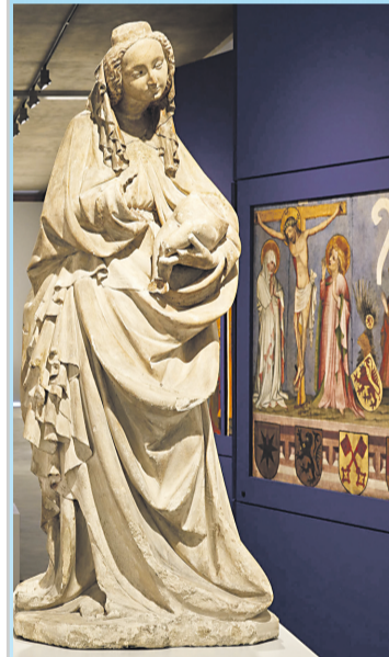
Ausstellungsansicht Mittelalter

Welt im Wandel Das Rheinland vom Mittelalter bis Morgen Dauerausstellung Landesmuseum Bonn