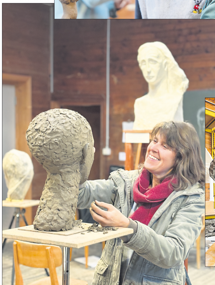
unten: Portraitstudien