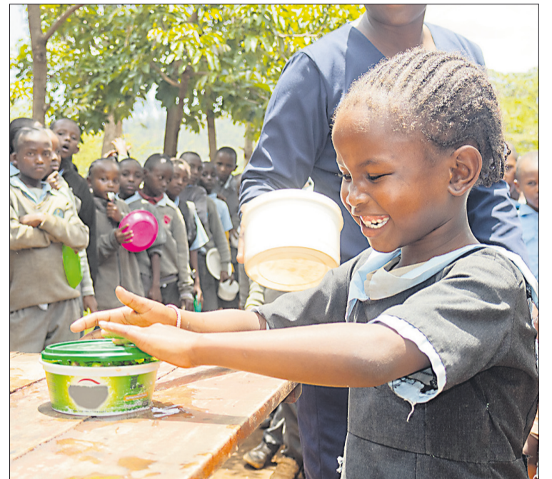
Ein Beispiel, wie Ihre Hilfe vor Ort ankommt, sehen Sie hier am Beispiel des Lebensmittel-Verteilungs-Programms unseres Partners CIFORD

Deshalb bitten wir aktuell um die Unterstützung für akute Nothilfe. Unsere Partnerorganisationen versorgen Schulen