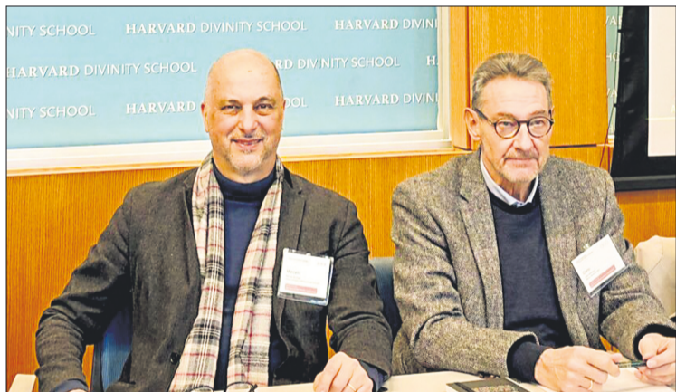
Professoren der Hochschule brachten ihre Forschungsperspektiven in Panels zu Pädagogik, Meditation, Medizin und Religionspädagogik ein