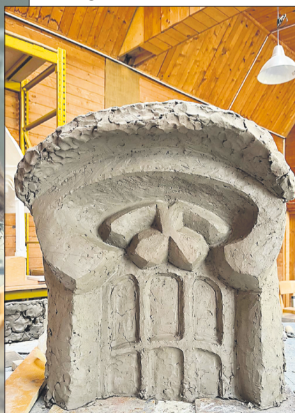
oben: Modell Detail erstes Goetheanum Foto: Kunststudienjahr © Sektion für Schöne Wissenschaften