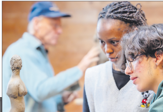
rechts: Kunststudium Herbst 2015 - Atelier Nicolas Pestifilippo

Anmeldung bis zum 31. Juli 2026 Weitere Informationen und Anmeldungsbedingungen: studium.goetheanum.ch/de/ kunststudienjahr sbk@goetheanum.ch