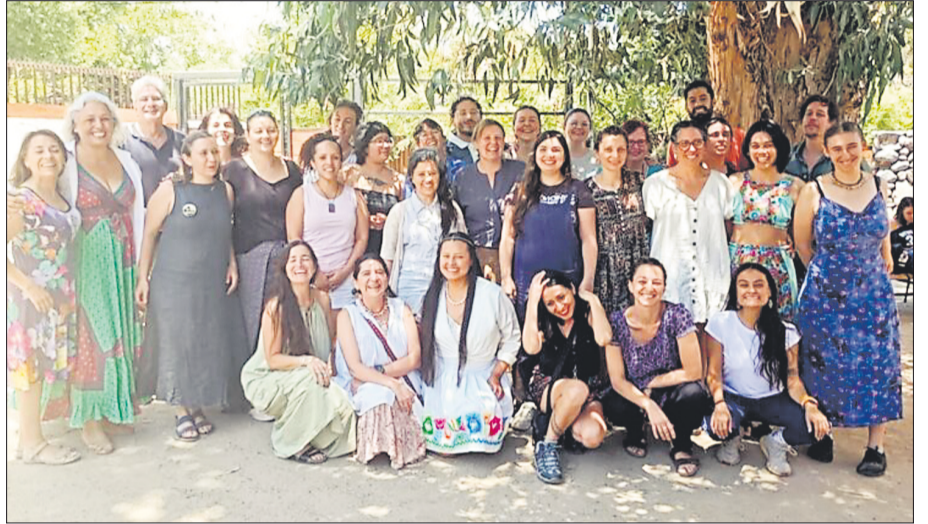
26 Studierende aus sieben Ländern trafen sich auf dem sonnigen Campus der Waldorfschule Colegio Micael in Santiago de Chile.

chentliche Online-Seminare mit intensiven digitalen und Präsenz-Blockwochen, wobei jedes Jahr im Januar eine zehntägige Präsenzphase in einem lateinamerikanischen Land stattfindet. Ziel des Kurses ist es, die Grundlagen der Waldorfpädagogik zu vermitteln und die Teilnehmenden