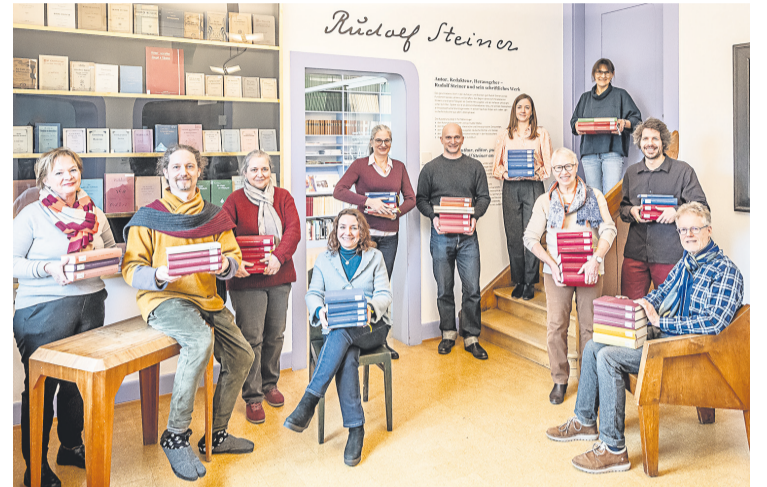
Mitarbeitende des Rudolf-Steiner-Archivs, Dornach, Schweiz, mit den GA-Bänden, die zwischen 2016 und 2025 erschienen sind

der Rudolf-Steiner-Gesamtausgabe am Goetheanum tauschen sich ehemalige und aktuelle Leitende des Rudolf-Steiner-Archivs über Erhaltung, Erforschung und Veröffentlichung von Rudolf Steiners Gesamtwerk aus. Im Haus Duldeck, dem Sitz des Rudolf-Steiner-Archivs, kann man mit Herausgeberinnen und Herausgebern über die Editions-geschichte ins Gespräch kommen; in der Goetheanum-Bibliothek informieren Mitarbeitende des Rudolf-Steiner-