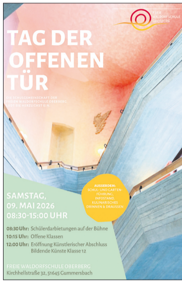
Plakat der Waldorfschule Oberberg Abbildung WDS Oberberg

Am Samstag, den 09. Mai 2026 laden wir daher herzlich ein zum Tag der Offenen Tür in die Waldorfschule Oberberg e.V., Kirchhellstraße 32 in 51645 Gummersbach. Worin unterscheidet sich die Waldorfpädagogik von der Pädagogik der Regelschulen? Und welchen Abschluss kann mein Kind an der Waldorfschule absolvieren? Kommen Sie mit Ihren Kindern vorbei, lernen Sie uns kennen und stellen Sie Ihre Fragen. Außerdem freuen wir uns sehr, in 2027 zwei 1. Klassen an unserer Schule begrüßen zu dürfen. Melden Sie Ihr Kind sehr gern an! Zu Beginn gibt es ab 8:30 Uhr Schüleraufführungen aus allen Klassenstufen in unserer Mehrzweckhalle zu erleben. Danach, ab 10:15 Uhr, beginnen die Offenen Unterrichte mit Projekten und Präsentationen in den Klassen. Dort haben Sie die Möglichkeit, Einblick in die vielfältigen Epochen- und Fachunterrichte zu bekommen. Für kulinarisches in der Frühstückspause und Mittagspause sorgt unter anderem unsere Schulküche, in der das Essen ausschließlich mit regionalen und mit Bioprodukten angeboten wird. Es wird Schul- und Gartenführungen geben, und es gibt selbstverständlich die Möglichkeit für Gespräche mit unseren Pädagogen. Auch die