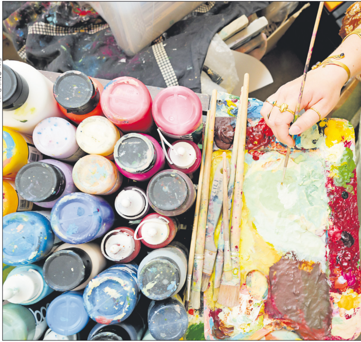
Im „PraxisStart Bildende Kunst“ können sich Studieninteressierte künftig über eine intensive Workshopwoche für einen Studienplatz qualifizieren – ohne klassische Bewerbungsmappe.

Die fünfzügige Workshop-Woche findet vom 29. Juni bis 3. Juli 2026 auf Campus I – Johannishof der Alanus Hochschule in Alfter bei Bonn statt und dient gleichzeitig als Eignungsprüfung für das Studium. Die Teilnehmenden arbeiten in verschiedenen künstlerischen Disziplinen – von Zeichnung und Malerei über Installation bis hin zu digitalen und zeitbasierten Medien. Begleitet werden sie von Lehrenden der Hochschule