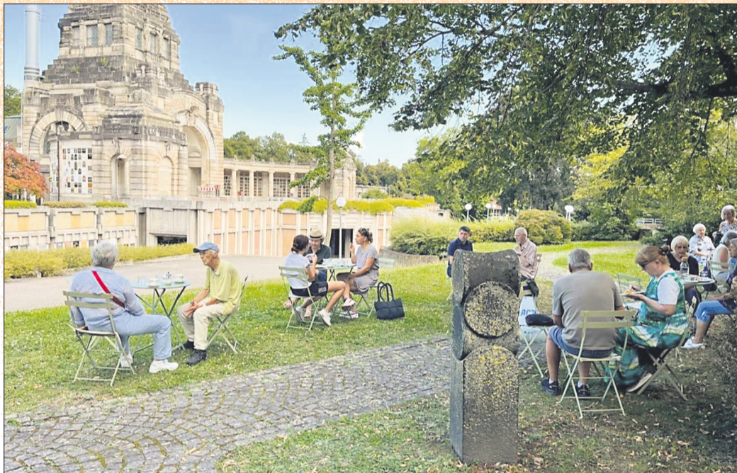
Besucher*innen beim Café- Kränzchen