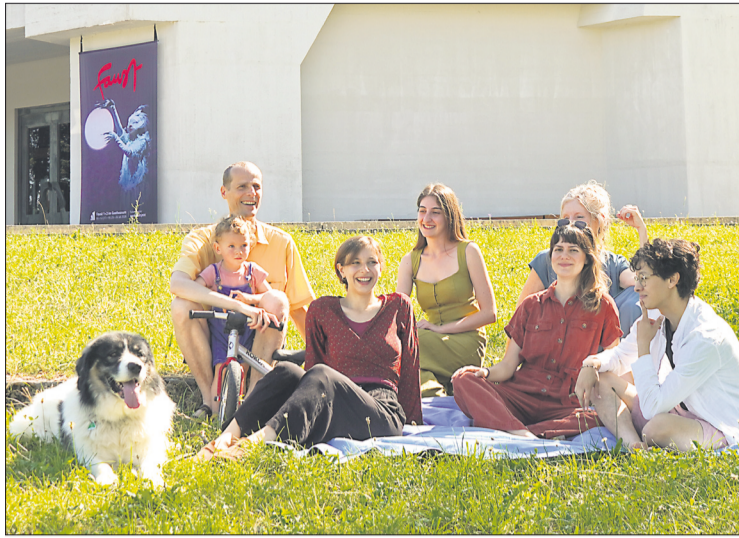
Mitspielende des «Faust» testen die Picknickdecken für die Faust-Festspiele 2026