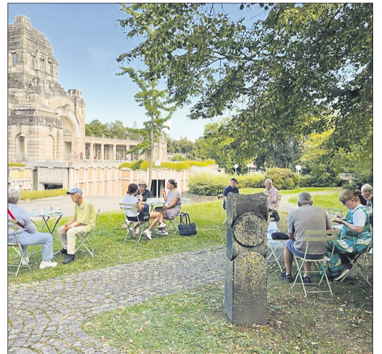
Besucher*innen beim Café-Kränzchen

„Gäst*innen erzählen von ihren verstorbenen Angehörigen und dabei fließt auch mal die eine oder andere