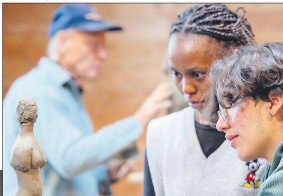
rechts: Kunststudium Herbst 2015 - Atelier Nicolas Pestifilippo

Anmeldung bis zum 31. Juli 2026 Weitere Informationen und Anmeldungsbedingungen: studium.goetheanum.ch/de/ kunststudienjahr sbk@goetheanum.ch