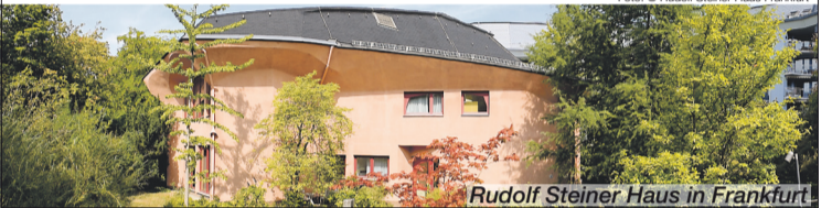
Rudolf Steiner Haus in Frankfurt